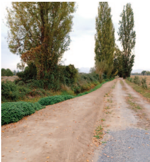
Chemin de l'Escourre