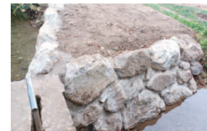
Réfection d'une écluse