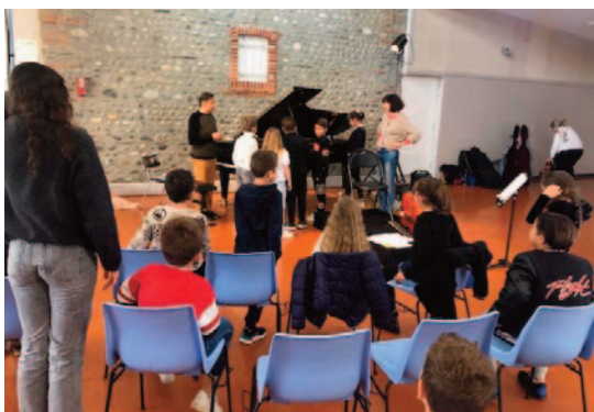
Médiation Conservatoire de Tarbes