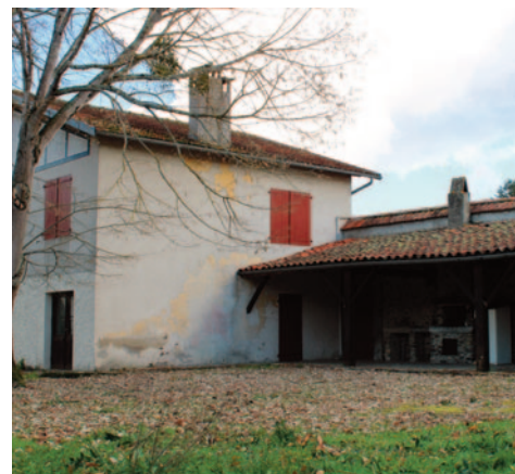
Maison Tiers Lieu