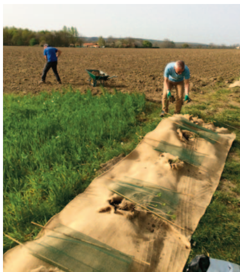
Plantation de haies