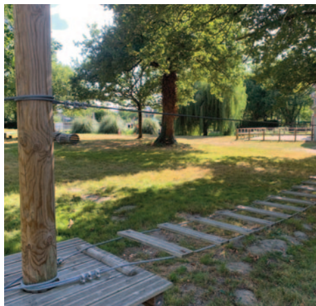
Aire de loisirs