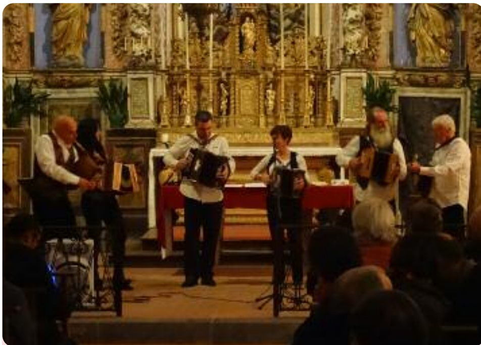
La Clique Mandreille

Le conseil municipal se joint à moi pour vous souhaiter une bonne année, une bonne santé et toute la réussite dans vos projets à chacun de vous ainsi qu'à vos familles.